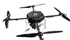
長時間(4時間)飛行 広域監視用ドローン DERD(デルデュ)