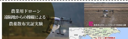
農業用ドローン 遠隔地からの操縦による 農業散布実証実験 農薬散布機 X1000による LTEネットワーク下での遠隔操縦試験