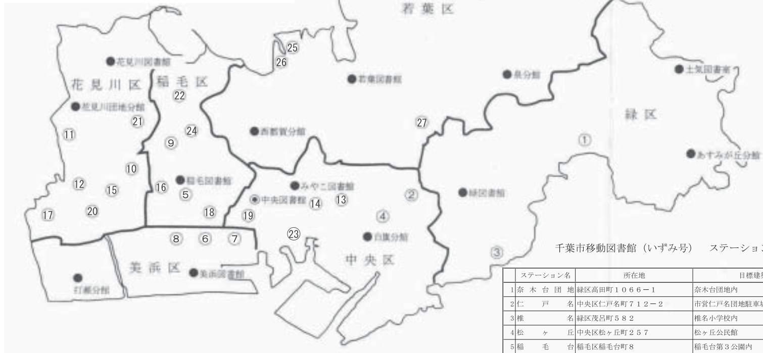
千葉市移動図書館（いずみ号）ステーション所在地一覧（設置数27ヶ所）