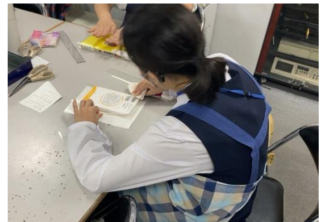
【本の装備（ブッカーかけ）】