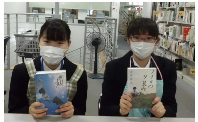
【うまくなりました。】