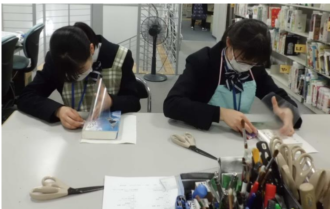
【本の装備（ブッカーかけ）】