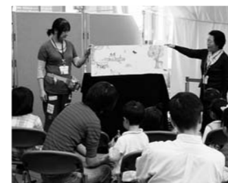
昨年の子ども読書まつりの様子