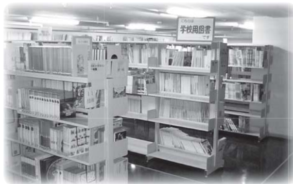
団体貸出用書架の様子