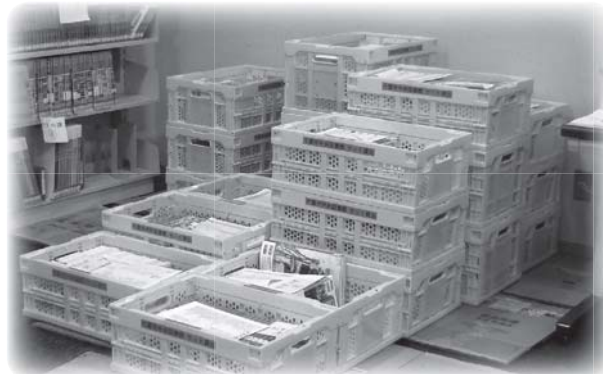
学校専用セット資料は、各地区図書館まで コンテナで配送します。 お近くの地区図書館での貸出・返却が可能です。