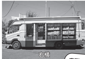
外側右サイド：絵本、ちしきなどの児童書と育児書などの書棚があります。

車両内部(左側)：文庫本、ノベルス、雑誌、外国小説、ガイドブックなどの書棚があります。