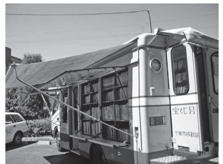
雨の日も安心：雨の日や暑い日には、車の中から両サイドにシートが出て、本を守ってくれます。