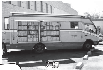
外側左サイド：料理、ガーデニング、エッセイ、時代小説などの書棚があります。

借りられる期間は、次の訪問日までです。また、いずみ号で貸し出した本は、千葉市の図書館・分館・公民館図書室でも返却できます。