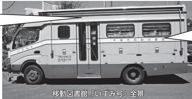
移動図書館「いずみ号」全景

車両内部(右側)：大人向けの小説、高学年、低学年向けの本、大活字本などの他に新刊本の書棚があります。