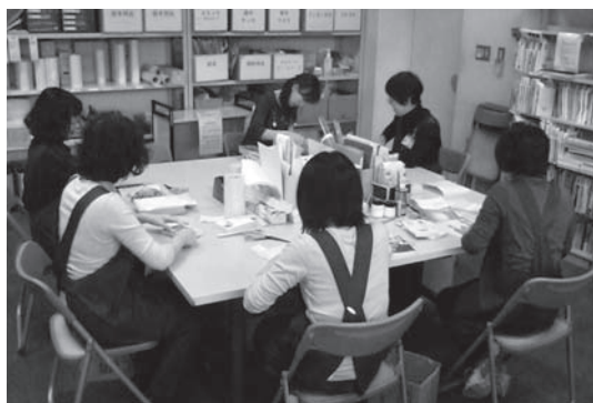
▲修理作業中の様子

このように、修理ができる場合はできる限り修理していますが、飲み物のシミ、動物の噛み跡、ペンによる書き込みやページの切り取り等、修理のできない状態になってしまった場合、弁償の対象となってしまうこともあります。利用者のみならず、市民の財産である本を大切に扱い、より多くの方に気持ち良くご利用いただきたいと思っております。