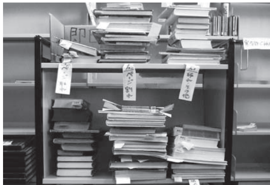
▲ある一日に中央図書館で回収された修理が必要な本

主な内容 【3面】子ども読書の日記念親子おはなし会のお知らせ 【4面】レファレンス事例紹介