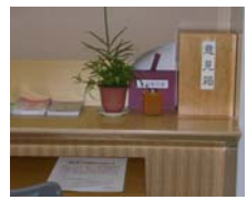
中央図書館の意見箱