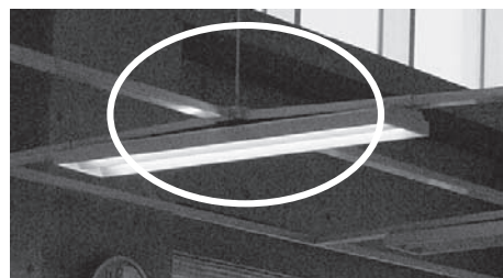
揺れて曲った蛍光灯の釣り金具(打瀬分館)