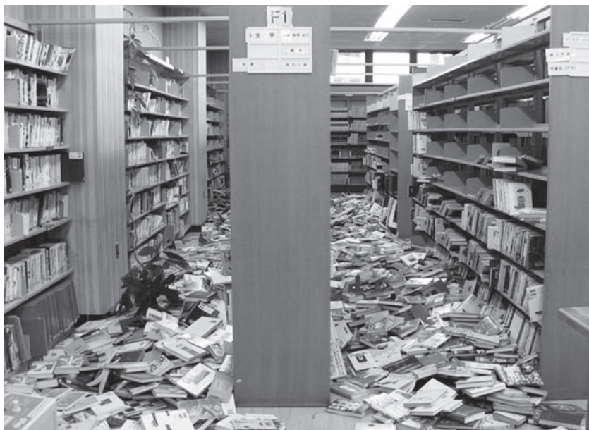
書架から崩れ落ちた本の山(美浜図書館)

この震災を契機として災害に対し図書館としてするべき対応や、スピーディーな情報提供ができる体制について考え、「安心・安全」な「身近で頼れるみんなの図書館」を目指します。